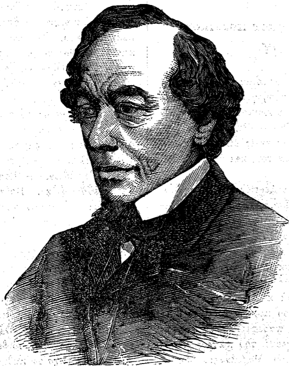
Ὁ Κόμης ΒΗΚΟΝΣΦΗΛΔ, ἀντιπρόσωπος τῆς Ἀγγλίας παρὰ τῷ ἐν Βερολίνῳ Συνεδρίῳ.

ΜΕΤΑΞΥ Ἀγγλίας καὶ Ἰσπανίας ποτὲ ναυμαχίαι συχναὶ ἐγένοντο καθ' ἃς οἱ Ἀγγλοὶ ἐξησκούντο εἰς τὴν θάλασσαν, μεγάλη δὲ ἐτηρεῖτο μεταξύ τῶν δύο