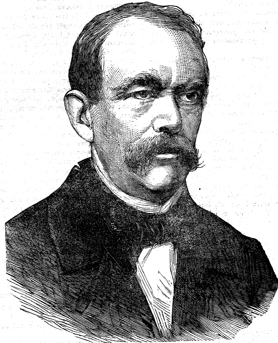
Ὁ Πρίγκηψ ΒΙΣΜΑΡΚ Ἀντιπρόσωπος τῆς Γερμανίας καὶ Πρόεδρος τοῦ ἐν Βερολίνῳ Συνεδρίου.

θέλει σὲ προστατεύσει» ἦσαν αἱ τελευταῖαι λέξεις τῆς μητρὸς αὐτοῦ ὅταν ὁ Παῦλος ἀνεχώρει. Ὅταν ὁ στόλος τῶν Ἰσπανῶν ἐφάνη, ἐκάλυπτε τὴν θάλασσαν· ἀλλ' οἱ Ἀγγλοὶ προσέβαλον αὐτὸν καὶ πολλὰ ἐκ τῶν ἰσπανικῶν πλοίων ἐβυθίσθησαν. «Κύτταξε ναύκληρε, τὸν Θρίαμβον, καταφέρεται πρὸς τοὺς ἐχθρούς», ἐφώναζεν ὁ Παῦλος, δεικνύων ἐν